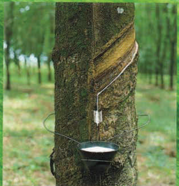
Latex récolté par saignée sur l'hévéa.

Issu à 100% de l'hévéa, le latex d'origine naturelle des matelas Sealy est un matériau rare et unique. Ses propriétés exceptionnelles offrent une incomparable élasticité et une grande tonicité. Le latex 100% d'origine naturelle épouse parfaitement l'anatomie et procure à la fois confort douillet et soutien ferme.